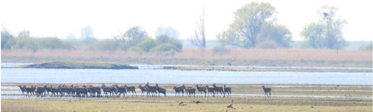
Edelhert – Oostvaardersplassen.