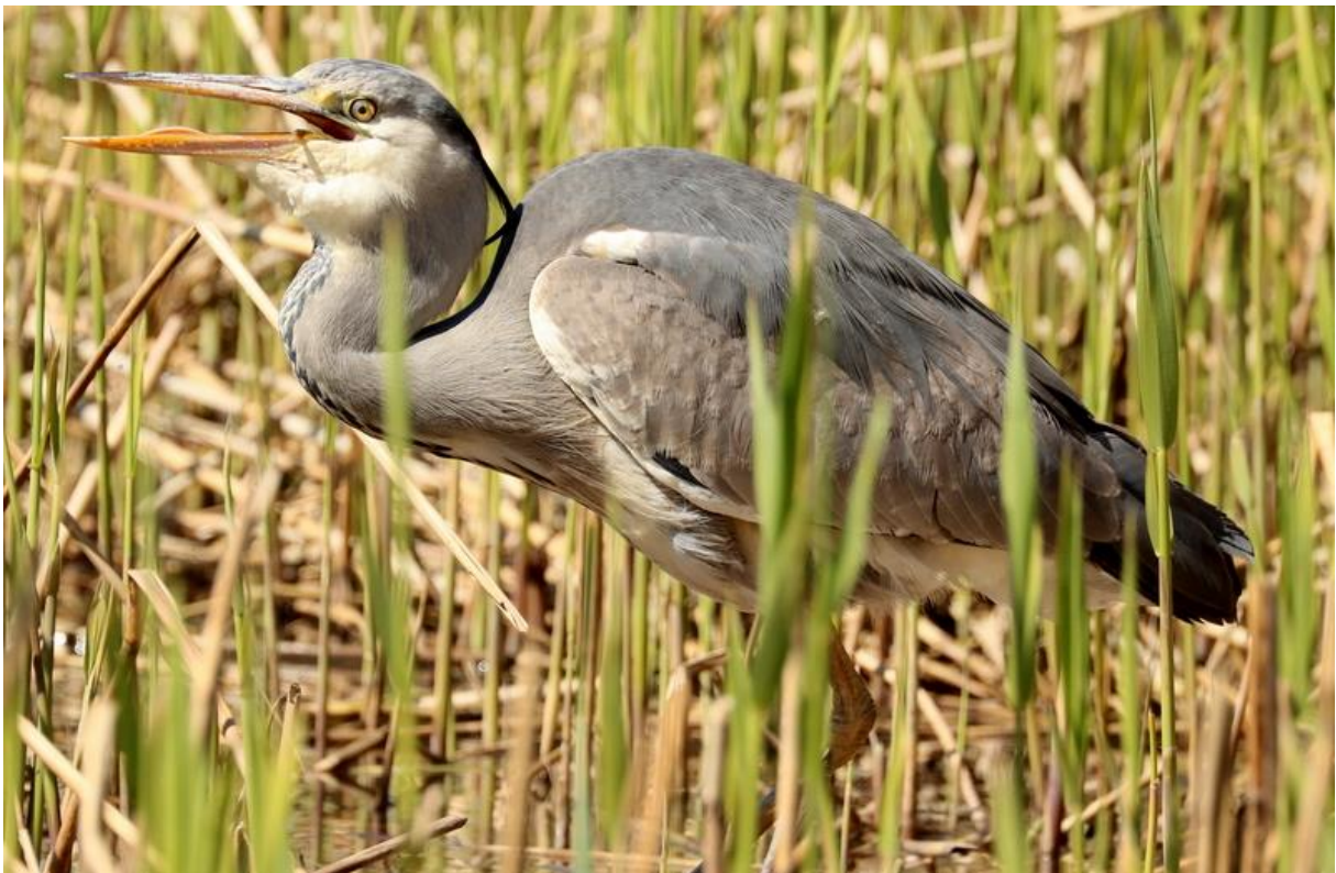
Blauwe reiger – Oostvaardersplassen.

We wandelden door een wilgenbos waar vooral de zang van de Zwartkop dominant was, de mannetjes hebben een zwarte kop en de vrouwtjes chocoladebruin.